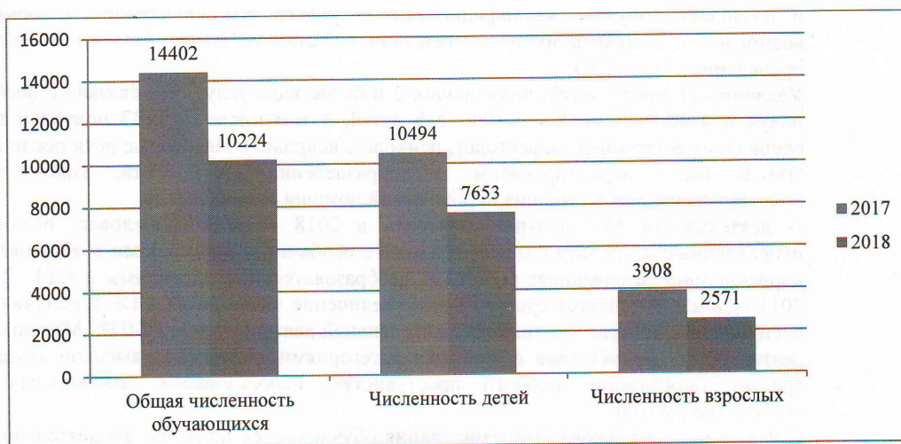
Рис. 1 Сравнительный анализ численности обучающихся

На рис. 1 прослеживается снижение в 2018 году как общей численности обучающихся, так и по категориям соответственно. Это связано с увеличением числа запросов на комплексную и более продолжительную помощь.